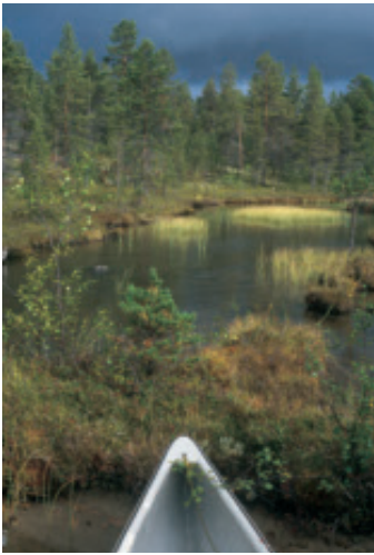
Kiemurteleva pikkupuro Suprun seudulla. Ukkosrintama lähestyy vauhdilla.

kaisin kohti Sevettijärveä. Nitsijärvikin on altis tuulille. Tällä kertaa sivumyötäinen iltatuuli avitti ja matka taittui vauhdilla.