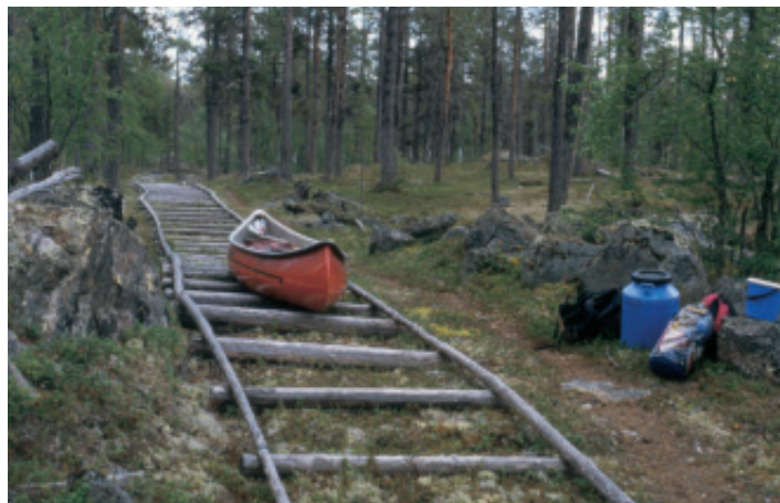
Hammasjärven vetotaipaleilla kanootin kiskominen tuntui jo helpommalta kuin alkumatkasta.

Meloimme Nitsijärven itärannan tuntumassa pohjoiseen. Tähän asti olimme tulleet etelään ja nyt käännyimme ta-