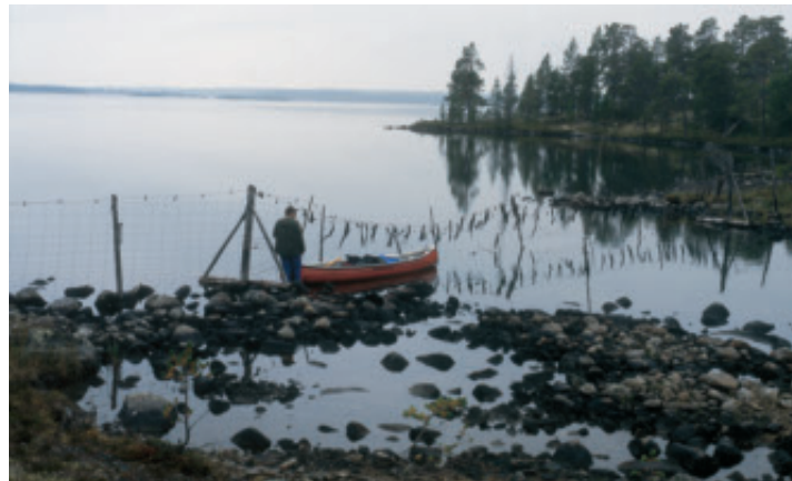
Eipä olekaan ennen tullut kuljettua kanootilla poroaidan portista. Suolisjärven Isosaaren eteläpäätä.

seksi koskeksi. Maata myöten piti kulkea pitkiä pätkiä. Ensin kannoimme varusteita, sitten kanoottiin ja vielä toisen reissun varusteita. Ja olin mennyt kotona lupailemaan vaimolleni, että tällä kertaa voimme ottaa patikkareissuja huolettomammin tavaroita mukaan.