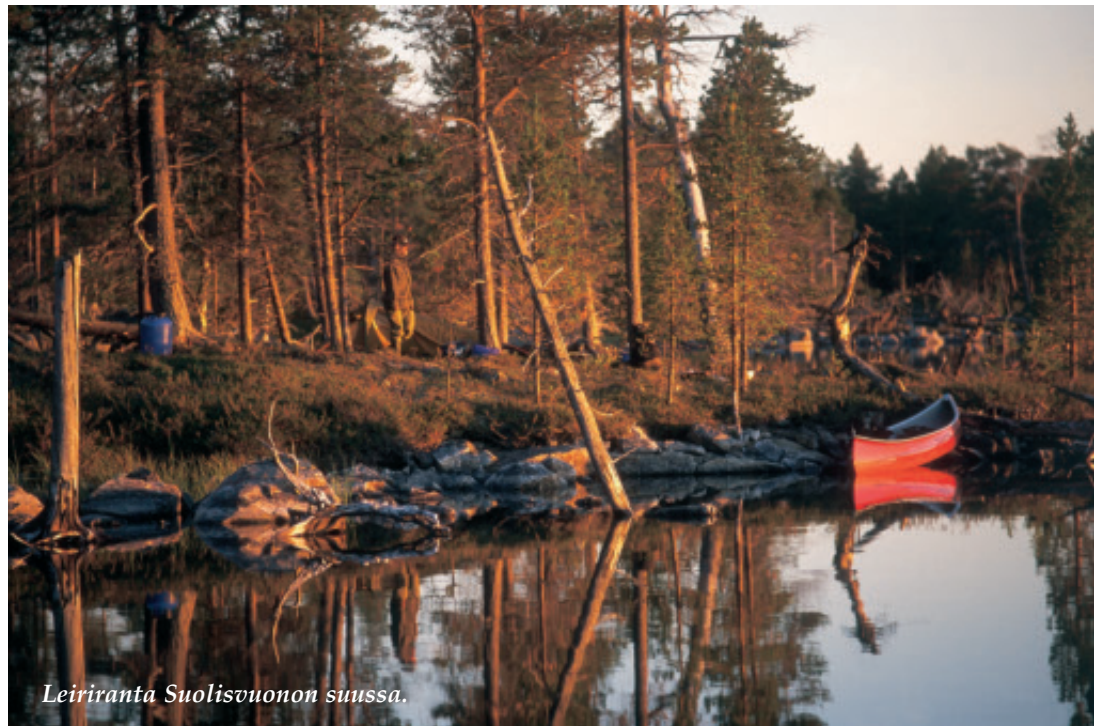
Leiriranta Suolisuonon suussa.

Leiripaikkaa sai illalla hie-man haeskella, sillä Inarijärven rannat ovat monin paikoin kivisiä. Telttarannassa tuikki jatkuvasti ja asiaa täytyi tutkia. Vaakanmittaiset harrin ja taimenen poikaset seurailivat lippojani,