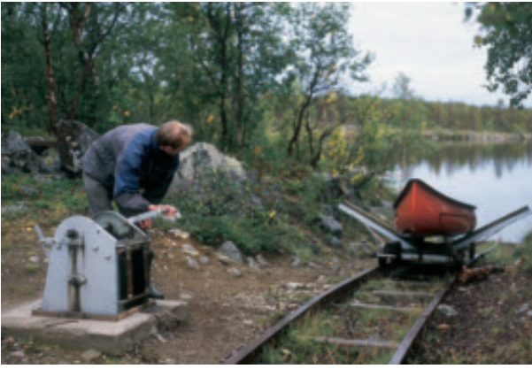
Suolistaipaleen veneenvetorata vinsseineen. Nitsin-koskessa on samanlainen, mutta paljon pitempi rata.

ka istutettu vankka lehtikuusi pihakentällä sekä pieni kivilaituri Suolijärven päässä muistuttavat entisaikain kulkukeinosta vielä sittenkin, kun viimeiset rakennusten jäänteet joskus ovat maatuneet.